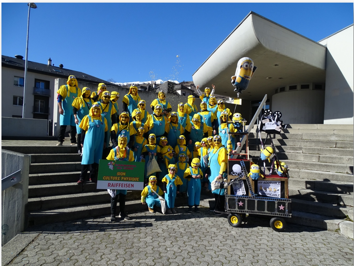
2020 Carnaval sur le thème Silence ! Sion on tourne