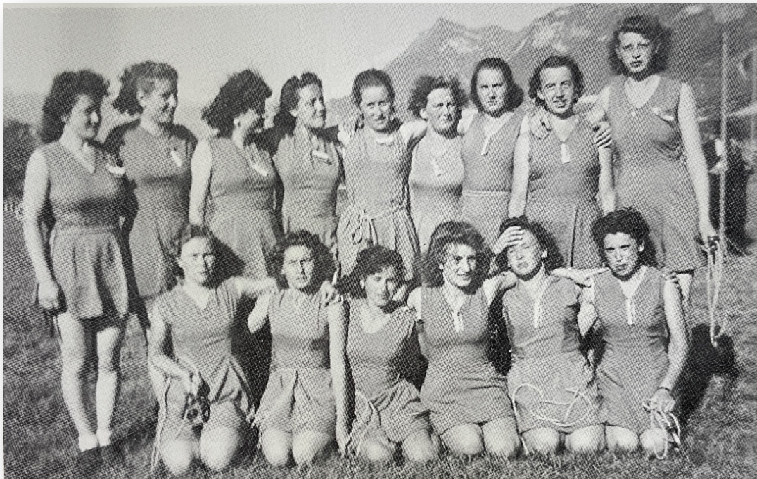
1941 Fête cantonale à Sion