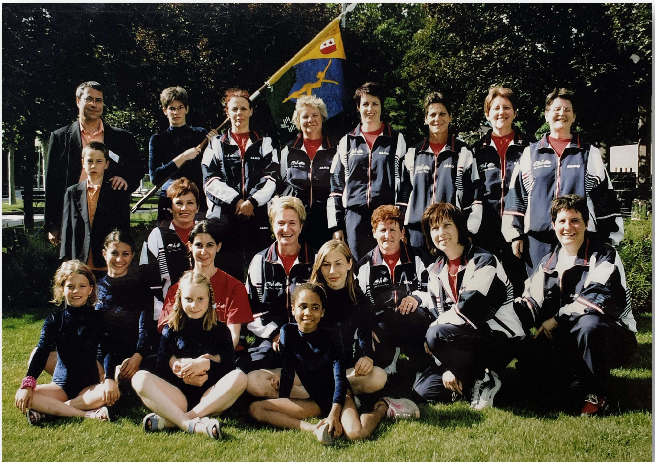
2004 100 ème anniversaire de l'harmonie municipale