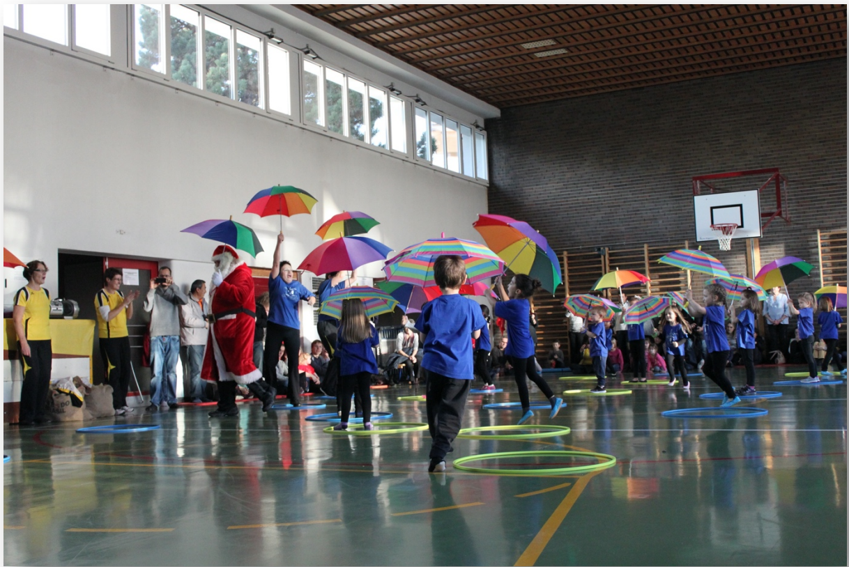
2016 St Nicolas